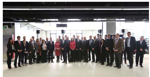
图：在奥迪股份公司合影 Abb.: das Gruppenfoto bei Audi AG